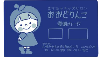
登録カードの作成