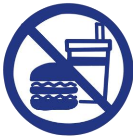
食事は出来ません