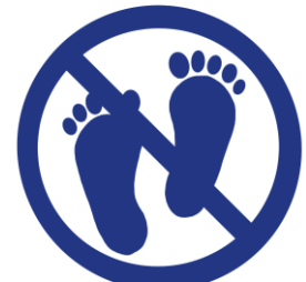
館内は靴下着用を お願いします