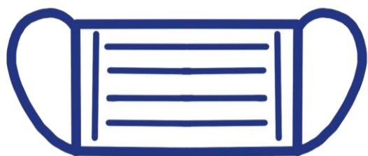
マスク(不織布)の着用