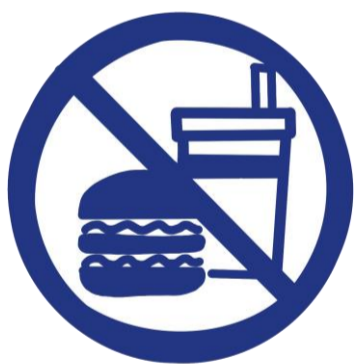
食事は出来ません